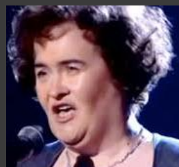
Susan Boyle – Singer