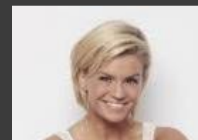
Kerry Katona – Reality TV contestant

Obsessive Compulsive Disorder Depression Stress-Related Illness Alzheimer's Disease (Dementia) Bi-Polar Disorder Post Natal Depression Panic Attacks