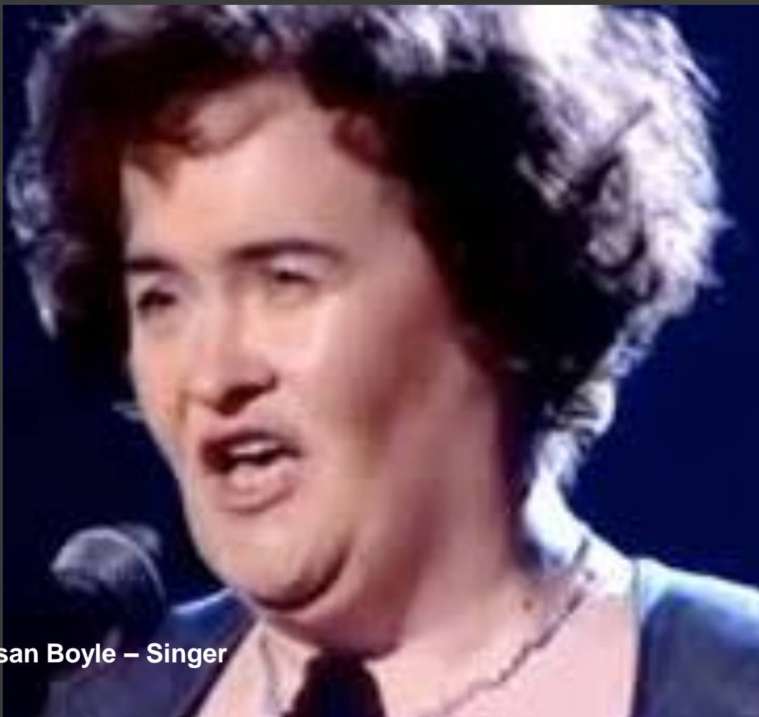
Susan Boyle – Singer