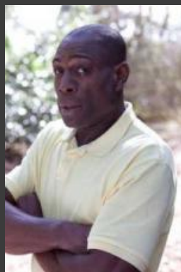
Frank Bruno - Boxer