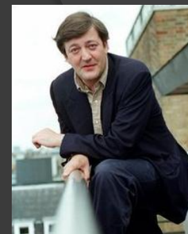
Stephen Fry – Writer/ presenter