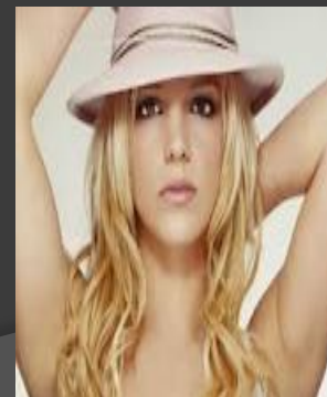
Britney Spears - Singer