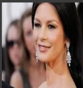
Catherine Zeta Jones - Actor