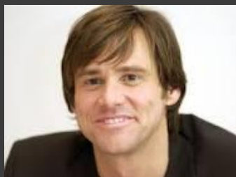
Jim Carrey - Actor