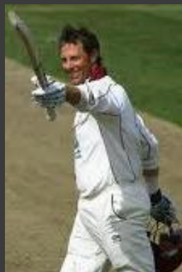
Marcus Trescothick - Cricketer

Obsessive Compulsive Disorder Depression Stress-Related Illness Alzheimer's Disease (Dementia) Bi-Polar Disorder Post Natal Depression Panic Attacks