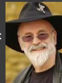
Terry Pratchett – Discworld Author