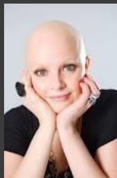
Gail Porter – TV presenter